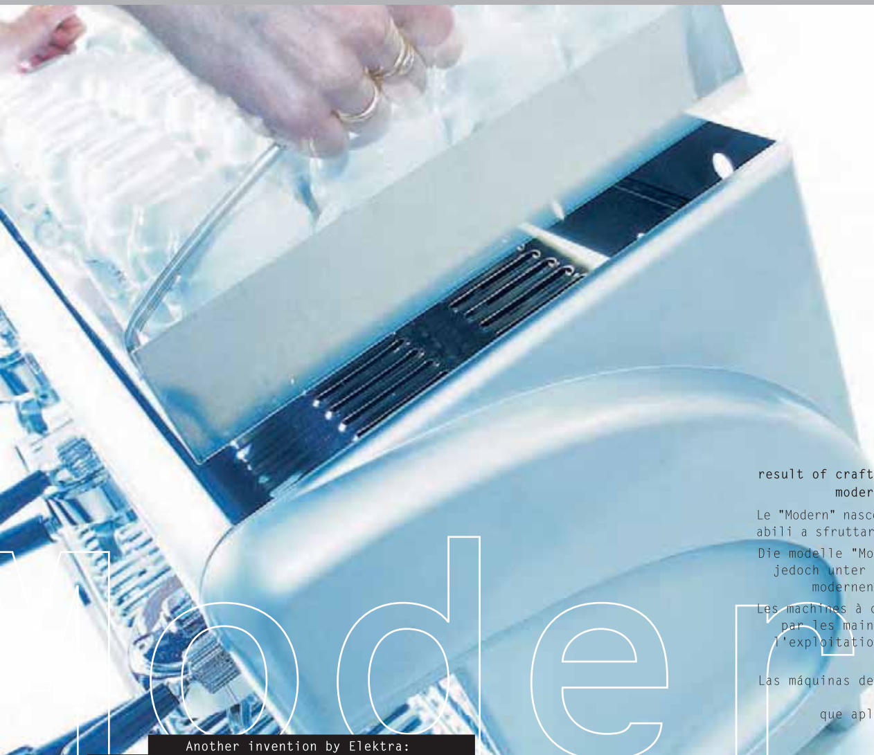
Another invention by Elektra: the pull-out-tray.

Un'altra invenzione Elektra: il vassoio portatazze estraibile.